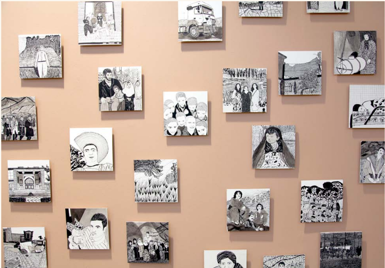
Osa kuvataiteilija Dzamil Kamangerin teoksesta Kurdilämää Seepia sateenkaari -näyttelyssä.

toimitilat ovat Hyvinkään Villatehtaalla vuonna 2005 avatussa Lasten ja nuorten kulttuurikeskus Villa Artussa. Samoissa tiloissa toimivat myös taiteen perusopetusta antavat Hyvinkään kaupungin Lasten ja nuorten kuvataidekoulu sekä Taito-Uusimaan käsityökoulu Helmi. Kulttuurikeskuksen toimijoita yhdistää innostus luoda Villa Artusta valtakunnallinen kokeellisen taidekasvatuksen laboratorio, jonka yhdessä suunniteltuja hankkeita tukevat kaikkien kolmen toimijan asiantuntemus ja verkostot.