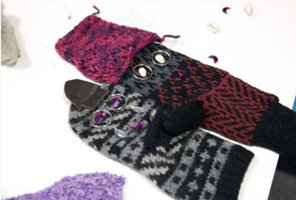
Isovanhempien ja lasten Käsi kädessä -työpajan satoa.

Aalto-yliopiston kansainvälisenä yhteistyönä syntynyt näyttely esitteli Helsingissä, Milanossa (Italia) ja Nantesissa (Ranska) toteutettuja työpajoja, joissa kehiteltiin keinoja huomioida ihmisten toiveita ja tarpeita heidän omassa elinympäristössään. Villa Artun näyttelyn yhteydessä toteutettiin Aalto-yliopiston opiskelijoiden vetämät työpajat, joissa ikä-ihmiset ja lapset työskentelivät yhdessä. Työpajojen tuotokset tulivat osaksi näyttelyä.