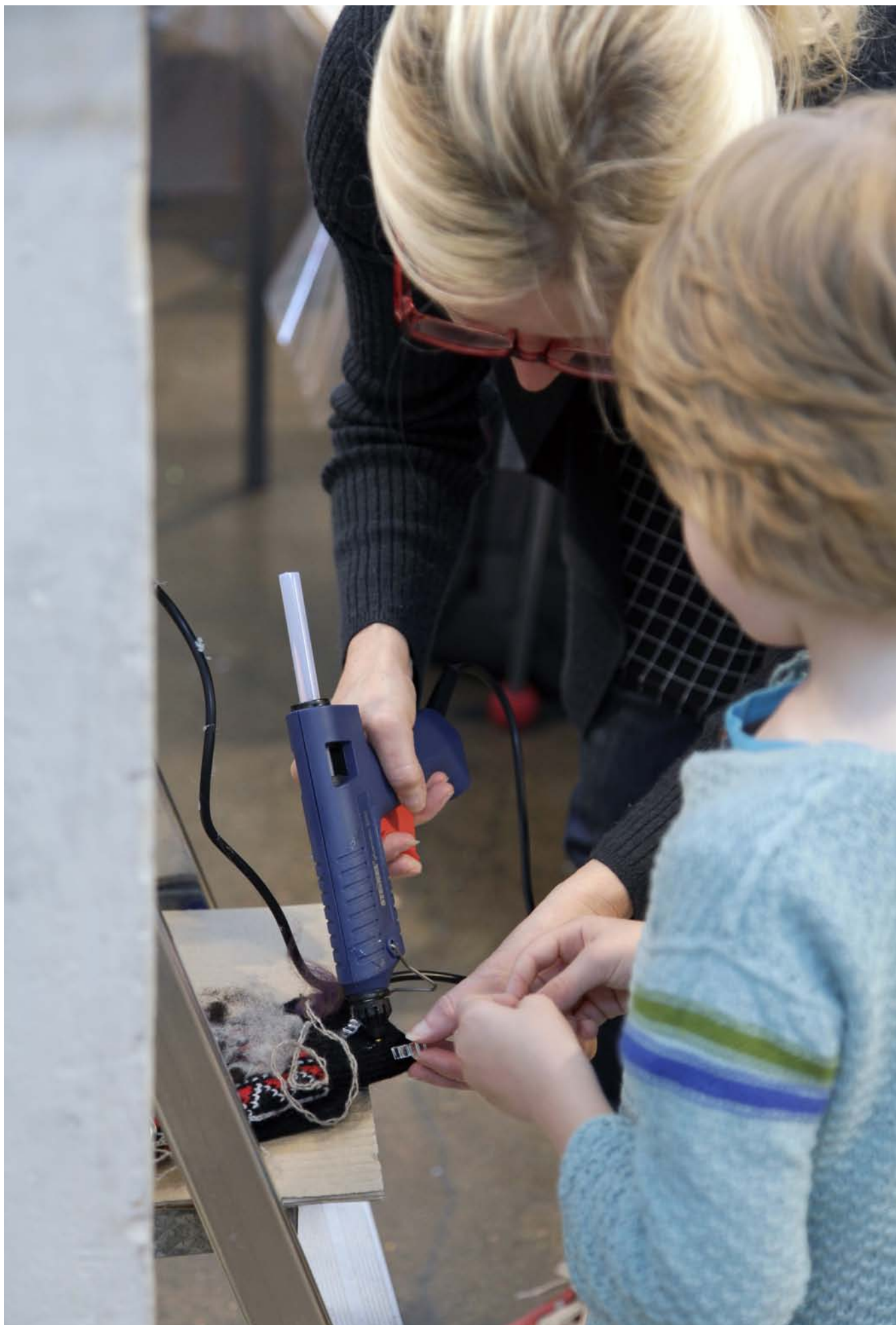
Isovanhempien ja lasten yhteisessä Käsi kädessä -työpajassa suunniteltiin ja toteutettiin mielikuvituksellisia hansikkaita.