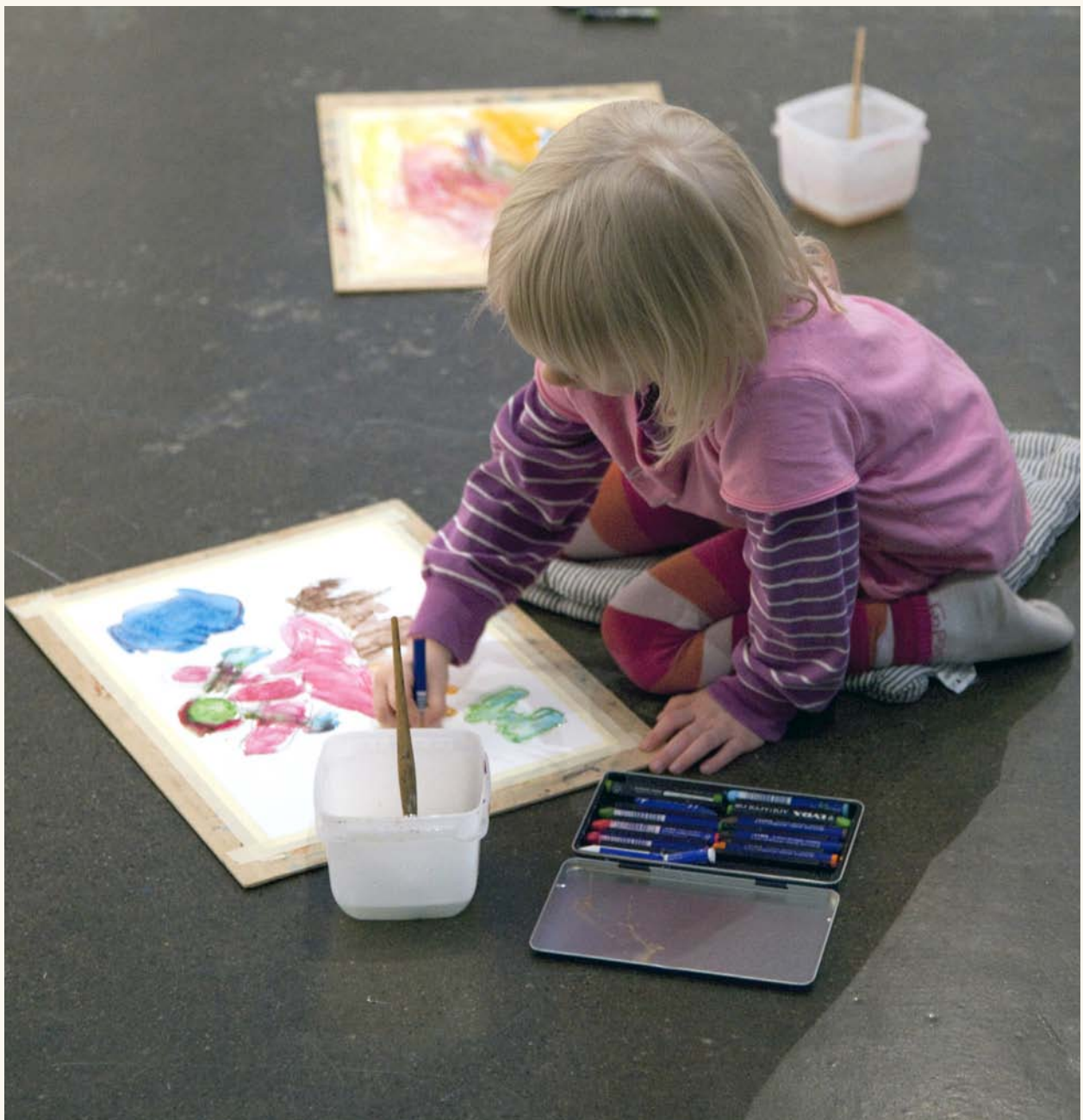
Etelästä tuulee -näyttelyn kuvitustyöpajassa tehtiin oma kuvituskuva.

Taidekeskuksen kirjanpidosta ja palkanlaskennasta vastasi Tili- ja hallintopalvelu Ilmola Oy.