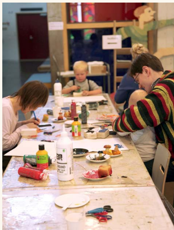
Rytmejä kuvin, sanoin ja soittimin -tapahtumapäivän kävijät pääsivät tekemään leimaamalla omia kuvallisia rytmejään.

Artun kesän näyttelyiden ja puutarhan avajaisissa julistettiin Fillarifilmi-kilpailun voittajat ja muut palkitut elokuvat. Avoinna oli myös kahden Aalto-yliopiston opiskelijan liikkuva työpajakahvila Kuutio.