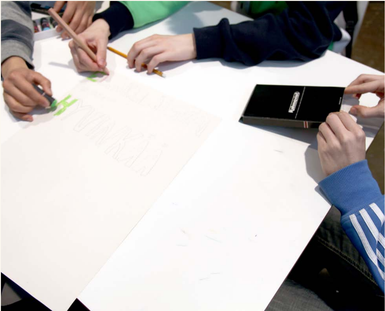
Kulttuuripolkulaiset suunnittelemassa julistetta.

Verkkosivuja www.artcentre.fi uudistettiin toimintavuonna. Ilmeeltään ja selattavuudeltaan kevyemmät sivut tuovat entistä enemmän esille kansainvälisen arkiston teoksia. Lasten ja nuorten taideteokset luovat sivujen visuaalisen ilmeen ja niistä on koottu lisää verkkonäyttelyitä. Nyt jokaisesta kansainvälisestä kilpailuista on oma verkkonäyttely. Myös englanninkieliset sivut ovat kattavammat kuin ennen. LAKUn omien sivujen lisäksi verkossa on Lasten ja nuorten taidekeskuksen, Hyvinkään lasten ja nuorten kuvataidekoulun ja Taito-käsityökoulu Helmin yhteinen portaali www.villaarttu.fi jonka kautta pääsee Villa Artun kolmen toimijan sivuille sekä Villa Artun Facebook-sivuille. Facebookia hyödynnettiin toimintavuonna kaikkien tapahtumien tiedottamisessa.