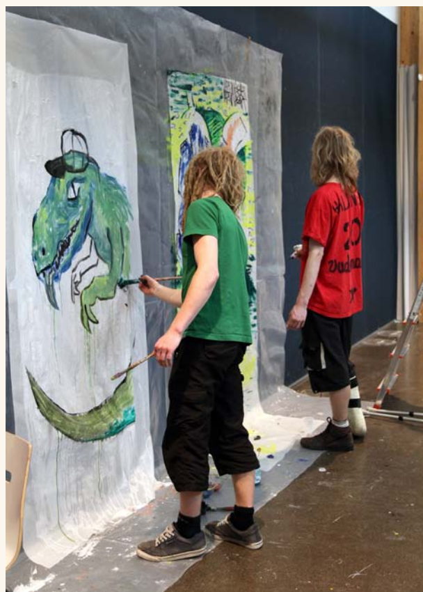
URB-työpajassa nuoret suunnittelivat ja toteuttivat julisteteoksen Kauppakasvatuskeskus Willan tapahtumatorille.

Vuosikokouksessa 23.5. keskusteltiin vilkkaasti LAKUN kansainvälisen näyttelytoiminnan uudistamisesta ja kehittämisestä seuraavan 15. Kv näyttelyn pohjalta.