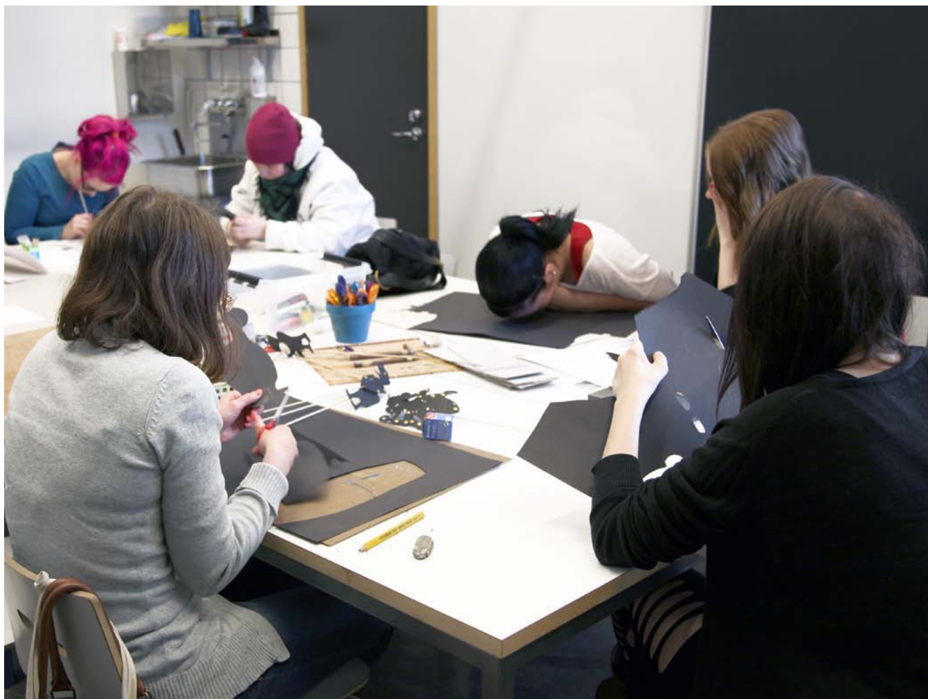
Nuoria Näe minut -työpajassa.