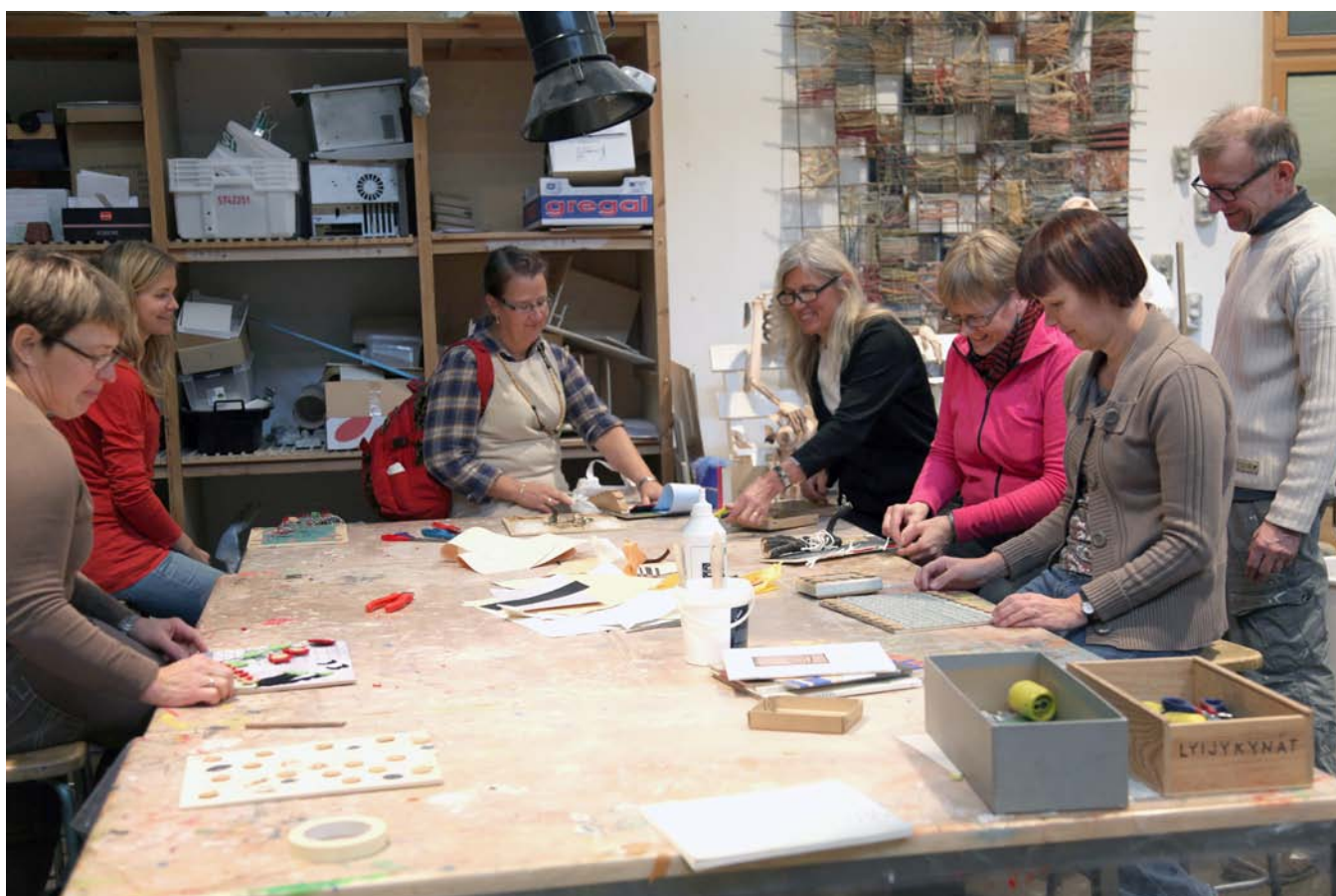
Taideaineiden täydennyskoulutusta varhaiskasvatuksen henkilökunnalle.