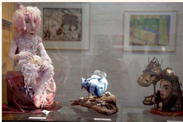
Etelästä tuulee -näyttelyn nukkeja.

Etelästä tuulee -näyttelyn yhteydessä koottiin taidekeskuksen arkistosta Käytävägalleriaan kokonaisuus virolaisten lasten tekemistä teoksista.