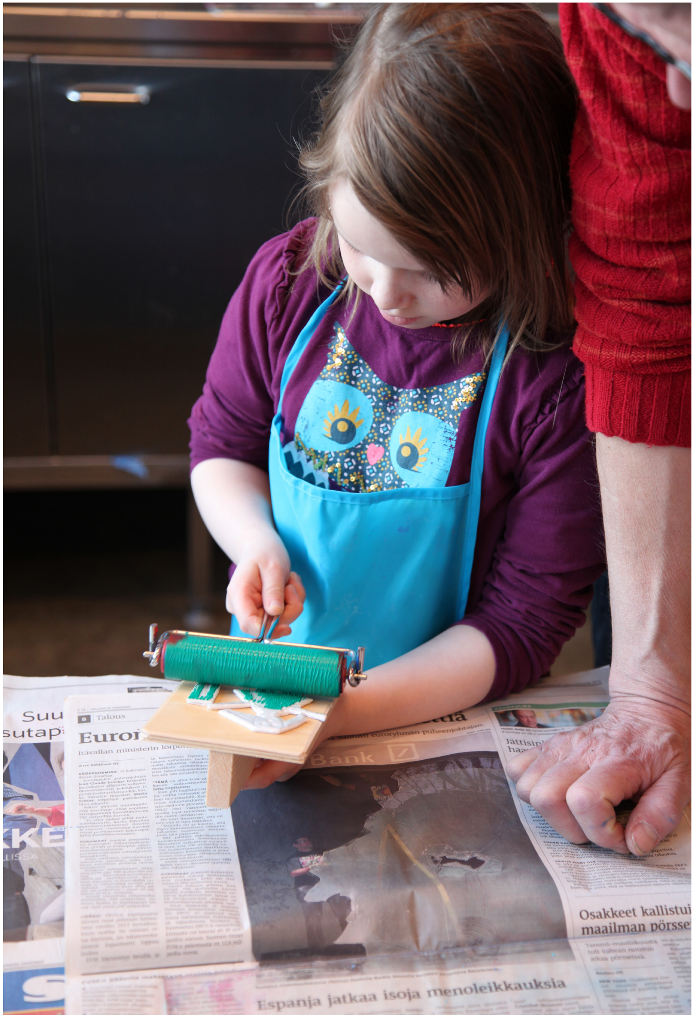
Kuvallisia rytmjä -työpajassa tutkittiin, mitä rythmi tarkoittaa kuvissa, kuvataiteessa ja kuvataidenäyttelyssä.